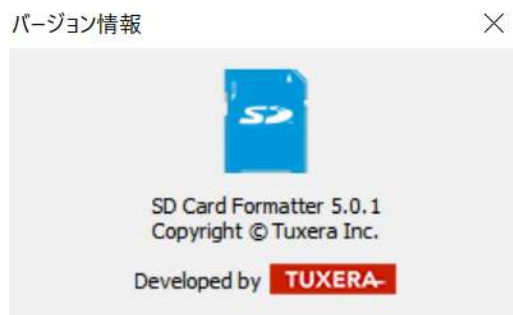
図 2: バージョン情報

Mac OS X/macOS ではメニューの[SD Card Formatter]をクリックし、さらに[SD Card Formatter について]をクリックします。