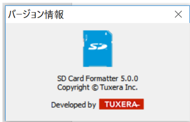
図 2: バージョン情報

Mac OS X/macOS ではメニューの[SD Card Formatter]をクリックし、さらに[SD Card Formatter について]をクリックします。